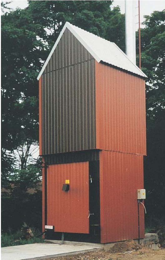
K. F. Halmfyr opstillet hos en kunde. Halmfyret er godkendt af DTI.

Skæveledvej 16 . DK-9352 Dybvad . Telefon 98 86 45 99 . Fax 98 86 48 99